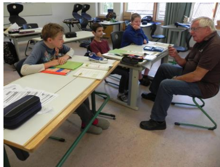
Förderung durch externe Experten

Das Angebot einer Klasse 9V1 / 9V2 ermöglicht es, nach der 9. Klasse den Mittleren Schulabschluss in zwei Jahren zu erhalten.